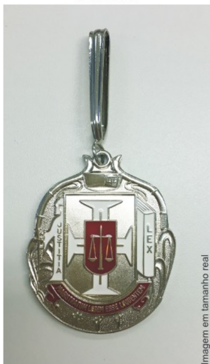
Imagem em tamanho real

Altura Medalha- 62,0 mm Largura Medalha (trecho mais largo) - 50,6 mm Espessura da Medalha na borda - 2,5mm